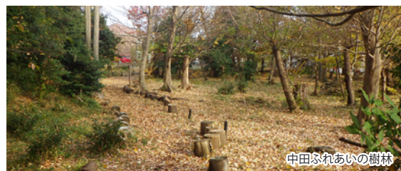
中田ふれあいの樹林

※ 持ち物、ご注意、集合場所詳細、雨天・荒天時の対応等は参加申込みの方へ別途ご案内します。 ※ 園路以外への立入りや樹林地保全活動体験を行います。