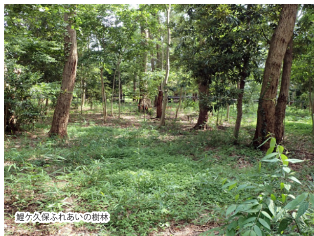
鯉ヶ久保ふれあいの樹林

※ 持ち物、ご注意、集合場所詳細、雨天・荒天時の対応等は参加申込みの方へ別途ご案内します。