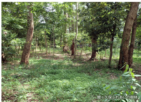
鯉ヶ久保ふれあいの樹林