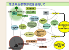
島村雅英「公害から環境へ」の時代から30年、SDGs目標年の2030年に向けた環境行動」