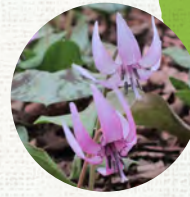
カタクリ： 里山を代表する春植物